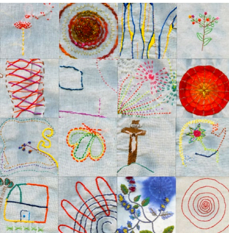
5. Flores, P. (2017). TEJIDO. Quito: Centro de Publicaciones PUCE. [Bordados varios autores]

actuar con apertura y escucha, actuar con respeto y empatía, actuar con paz y aceptación de la diversidad, actuar desde la fuerza interna. Esta es la propuesta de la obra TEJIDO : la convivencia pacífica y solidaria desde el cultivo de la atención en las fuerzas que nos construyen como seres